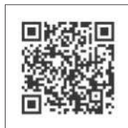
LINE 経済産業省 新型コロナ 事業者サポート